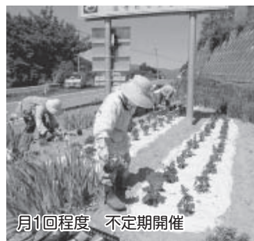
月1回程度 不定期開催

カラオケ、旅行、奉仕活動(花壇の管理)、季節の行事などいろいろな内容を企画し、毎回昼食を食べながらみんなで楽しく活動しています。魅力ある会にするために参加していただける仲間を募集しています。