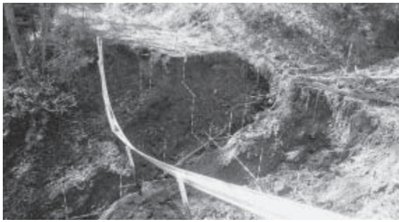
林道赤谷線 (R元年台風19号豪雨災害)