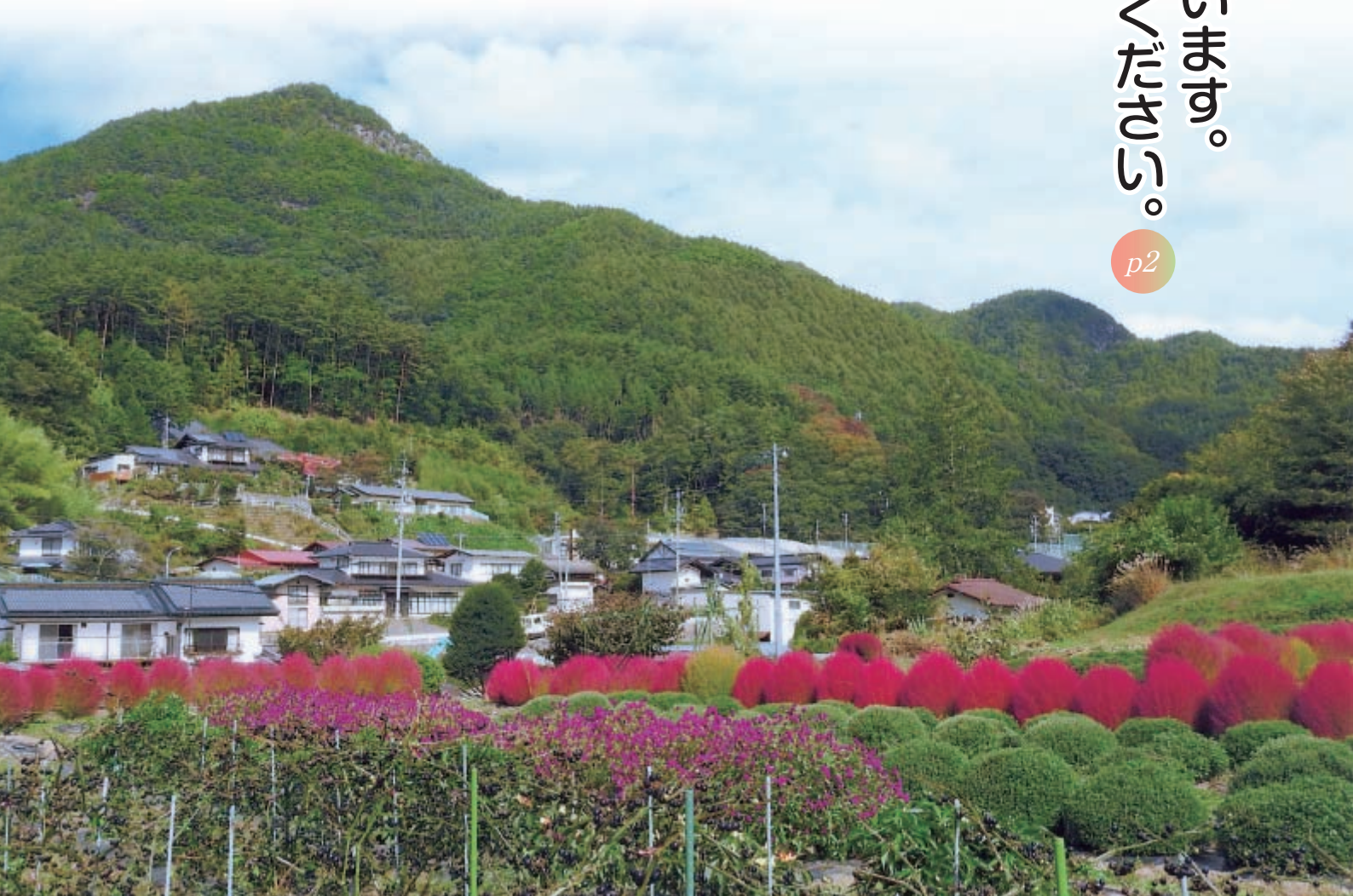
秋…彩り染まるコキア