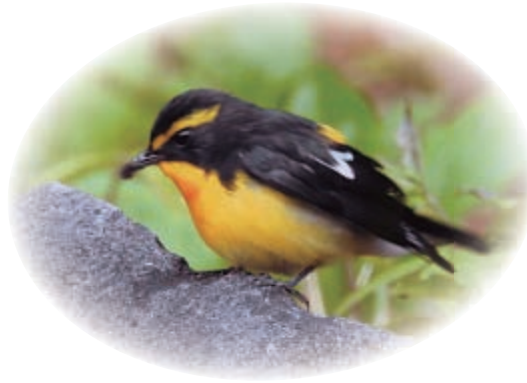
かわいらしいキビタキ (村内で)