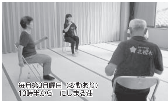
毎月第3月曜日 (変動あり) 13時半から にしまる荘

ストレッチや筋トレ、リズム体操など「笑い」を含めて行っています。若い方からお年寄りまで楽しく体操をしています。