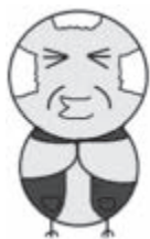
特殊詐欺被害抑止 キャラクター ピィいさん

※2つの方法でも画面が閉じない場合は 消費者ホットライン (118) または、 最寄りの警察署へ相談。一人で考えて いると犯人の思うツボです。相談は、 #9110 または、最寄りの警察署へ。