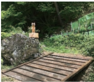
今日は誰が来てくれるかなあ?

5月のことです。役場から依頼を受けた建設業者が岩を割ったり、えぐれた川に橋を渡したり、石を積んだりして帰っていききました。