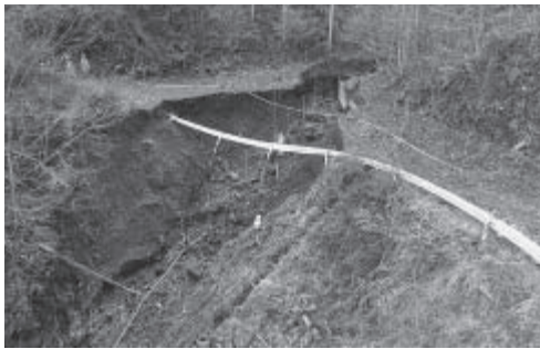
林道東山線 (R元年台風19号豪雨災害)