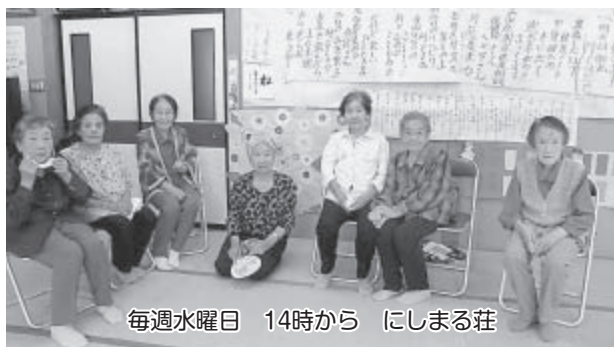
毎週水曜日 14時から にしまる荘

リハビリの先生との体操や工作、調理、レクリエーションなど毎週様々なプログラムで楽しく活動しています。送迎車が出ます。