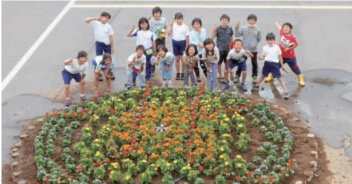
ポイントは「北」の文字