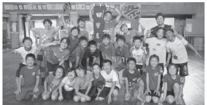
伝統芸能の大切さを学びました

北相木村には、「マツタケ」「りこぼう」「カラスマイタケ」等の自然の恵みに触れることが出来る魅力があります。ルールを守り遭難防止に努めながら、キノコ採りを楽しみましよう。