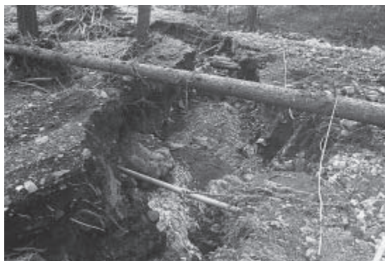
林道：武道線（長者の森奥）