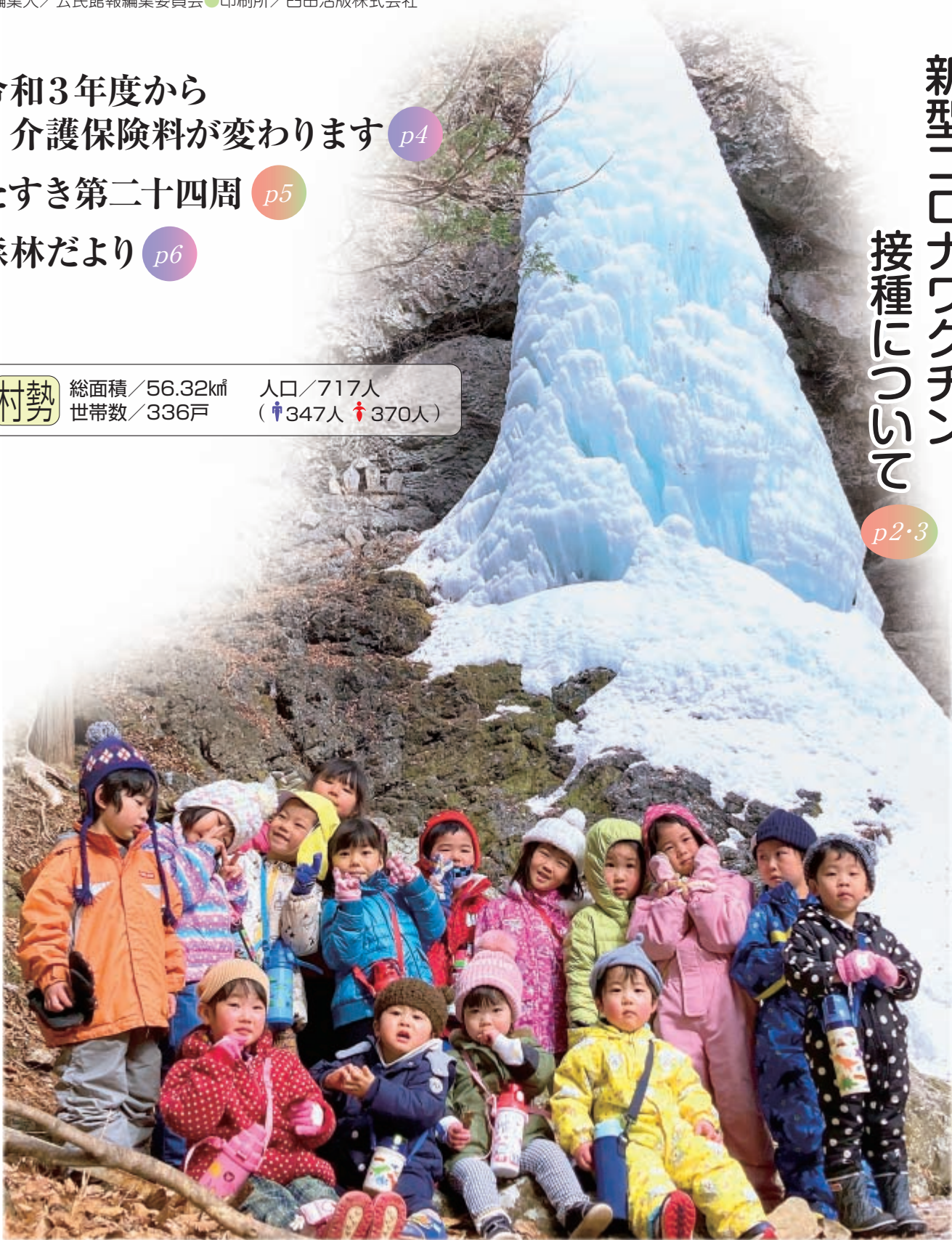
がんばって歩いたよ!