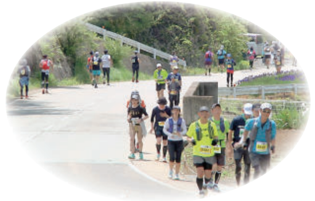
3年ぶりの100kmウルトラマラソン