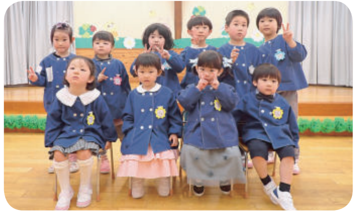
皆で仲良く遊ぼうね

を行うことができました。コロナ禍ではありますが、これからも子どもたちが楽しめるような行事やイベントを出来る限り行えるようにしていきたいと思っております。子どもたちが笑顔いっぱい保育園にしていきたいと思っておりますので、これからもよろしくお願います。また、お散歩の時など見かけた際には是非声を掛けてください。