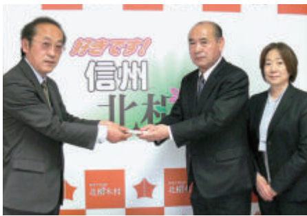
北相木村の為にありがとうございます