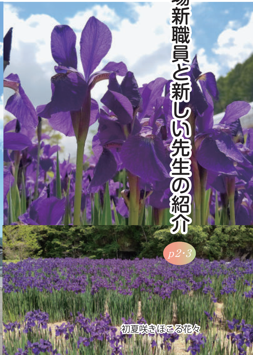
初夏咲きほころぶ花々