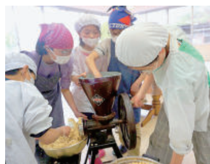
はじめての作業に興奮です

てすり潰し、ほぐしておいた麴と塩と合わせて、混ぜていきます。たくさん材料を混ぜていくうちに自然と粘土?遊びが始まり、大きな塔が出来ました。その後、壊して少しずつ丸めて樽に投げ入れ、大豆の煮汁を足し、さらによくかき混ぜてから表面を整え、蓋をしてカバーをかけて作業は終了です。