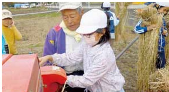
機械作業にドキドキ

1つ目は米とわらを分けるハーベスターという機械を使うのが楽しかったことです。ドキドキしながら、米とわらが分けられるのを見ていました。2つ目はわらを束ねるのをがんばったことです。分けられたわらを12束ずつ重ねてしまりました。そして米の残りで米ポ