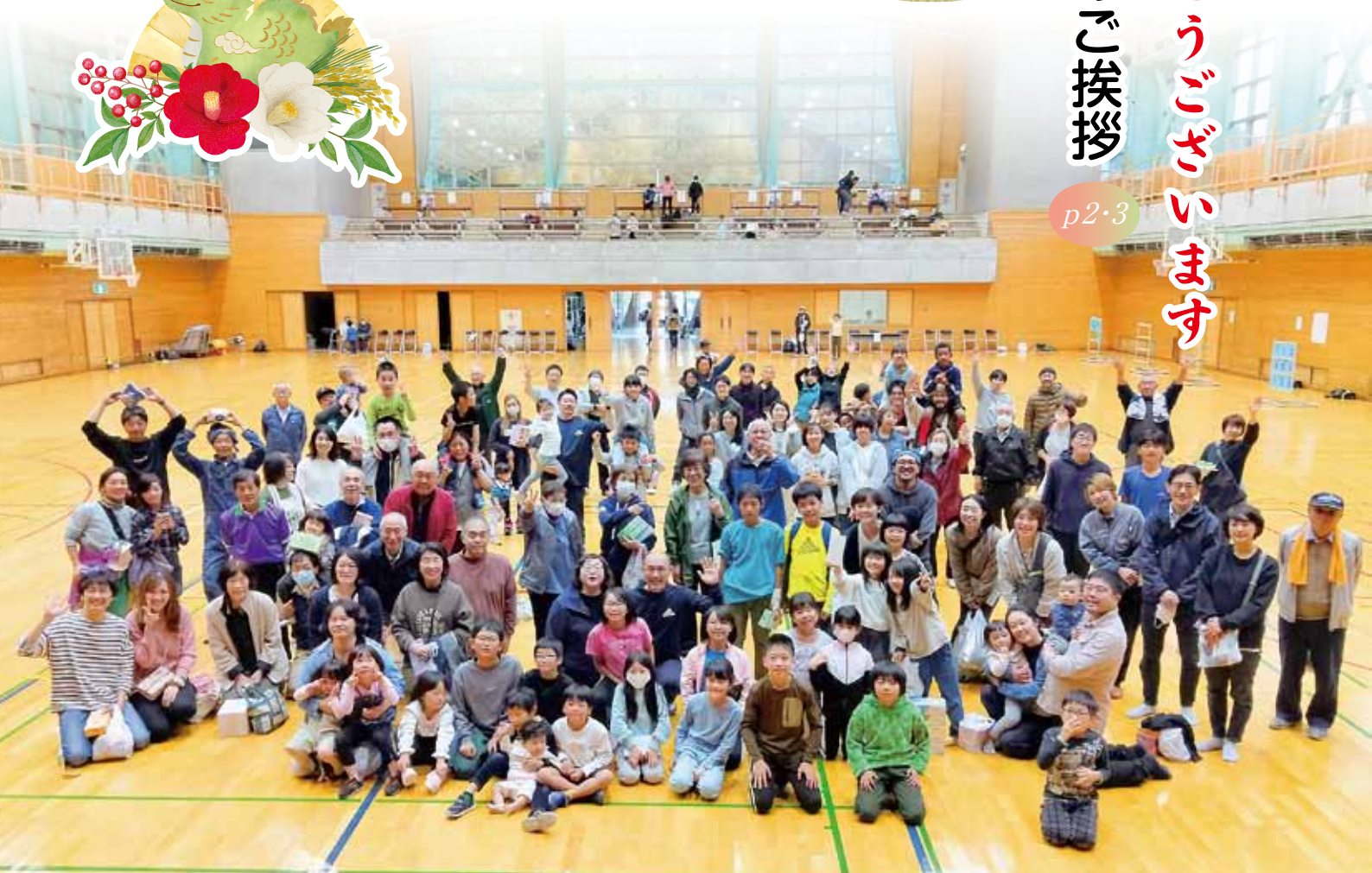
村民スポーツ祭りにて