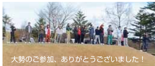
大勢のご参加、ありがとうございました！

「北相木村・村長杯ゴルフコンペ」が晴天の広がる八ヶ岳の麓、シャトルゼカントリークラブ小海で開催されました。当日は村民の他、村出身、村と関係のある愛好家の方々総勢27名が集まり、それぞれの腕前を競いました。