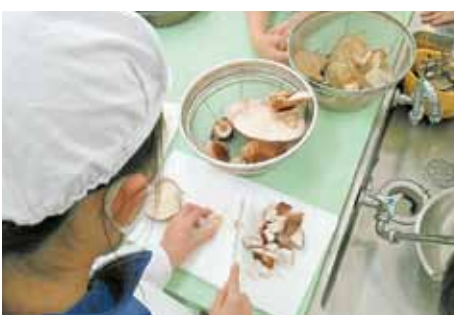
キノコ好きが増えますように

シイタケ・ヒラタケの収穫が出来ました。シイタケもヒラタケも収穫がするころができ、「小学校のキノコ(原木)」と「スーパのキノコ(菌床)」で食べ比べを行いました。子どもたちがおいしかったキノコ