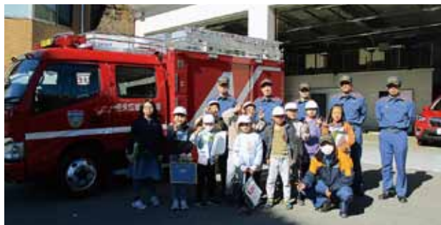
消防車大きかったです

ぼう火服を着させてもらいました。ぼう火服の重さは十キログラムくらいあって、ぼう火服を着るのも、着たまま走るのも大へんでした。しょうぼうしの人