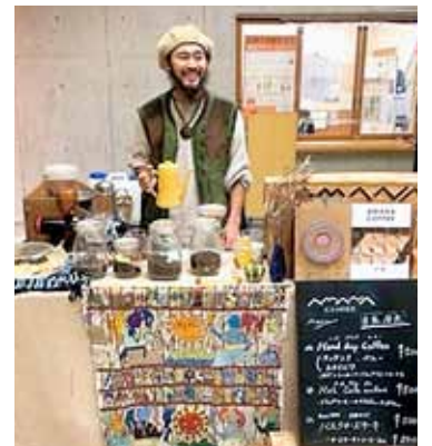
美味しいコーヒーありがとう

後半は、子どもから大人まで、誰もが楽しめて、気軽に参加できるさまざまなブースを設け、それぞれのペースで楽しむ時間としました。好記録を出そうと何度もチャレンジする姿や種目を純粋に楽しむ姿など、幅広い年齢層の方々が自分にできる範囲で思いきり楽しんでいました。最後は、小学生未満を対象としたお菓子投げや参加者を対象としたお楽しみ抽選会を行いました。運動する時とは違った歓声がありました。