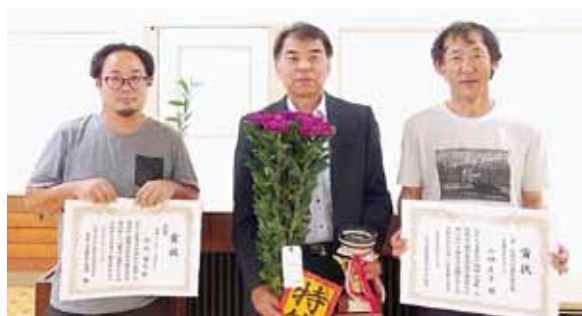
受賞おめでとうございます

相木に来て間もないある日の夕方、私は慣れない農作業の区切りがつかず、夕暮れになっても一人くわを握っていた。するとどこからともなく女性の声が聞こえてきた。 「もうしまうだよー。」 なんて温かい言葉なんだろう。こんな声かけを今までどこでも聞いたことがなかった。「しまいなさい」という命令形でもなく「終わらしましょう」と迫られるでもない。「もう遅いぞ」とがめられるでもない。その声を聞くと、それま