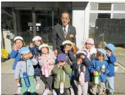
カレンダー使ってね！