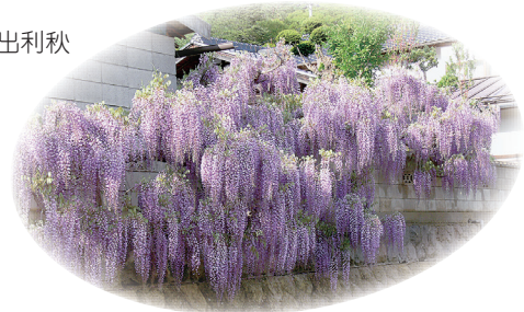
今年も見事に咲きました