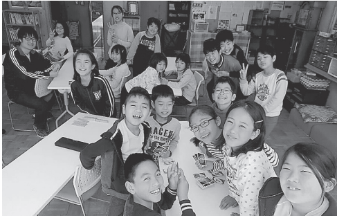
32期生の生活がスタート!

4月5日、北相木山村留学32期生の入村式が行われました。山村留学生は新規11名、継続6名の17名。親子留学も世帯数が増え、10世帯16名です。北相木小学校の児童の半分が山村留学関係の子どもで、これから一年間村でお世話になります。目標や楽しみはそれぞれですが、北相木の雄大な自然と温かい人に囲まれ、心も体も大きく成長しているほほしいです。ご迷惑をおかけする事もあるかと思いますが、今年度もよろしくお願ひ致します。