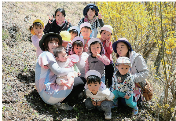
毎日元気いっぱいです

りしています。保育園でよく行くお散歩コースに、坂上にある桜の見える公園があり、最近近所のおじいちゃんやママさんが歩きやすいようにと道を作ってくれたので、これからお散歩に行くとって松ぼっくりやどんぐり拾いなどを楽しみたいと思います。 今年度も元気いっぱい