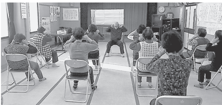
耳のツボを刺激～！いた気持ちいです

認知症予防には運動、特に有酸素運動が効果がある事は聞いたことがあると思います。有酸素運動とストレッチ運動の2つのグループで比べた時、1年後に有酸素運動をしていたグループは脳の海馬（記憶をつかさどる部分）の体積が約2%増加していたのに対し、ストレッチをしていたグループでは逆に減少していたとの研究があります。また1日に400m未満しか歩いていないグループは、それ以上歩いていたグループに比べアルツハイマーのリスクが2倍以上との研究もあります。自分の意志だけではなかなか続かない運動習慣ですが、一緒に楽しみながら行いませんか？気が付いたら沢山笑ったり動いたりしていますよ。申込み、詳しい内容は役場保健師までご連絡ください。