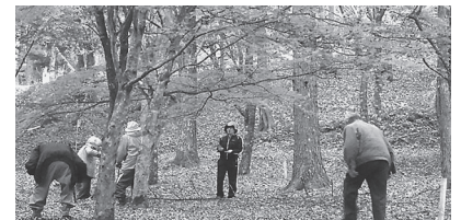
紅葉狩り 後ろ姿が素敵です