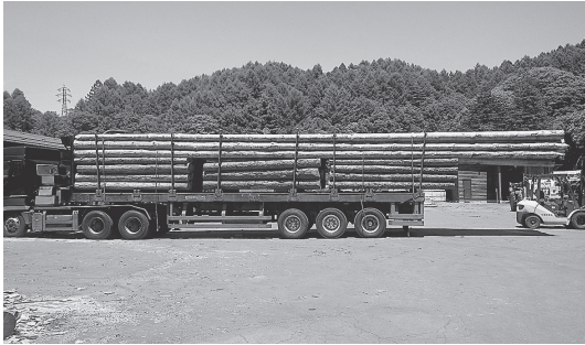
図2：16m杭材の出荷の様子