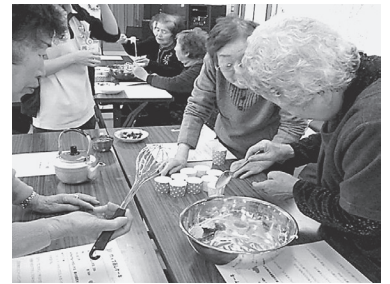
クリスマスのデザート作り 手伝い合いながら