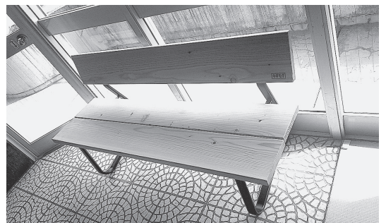
図5：カラマツベンチ（北相木小学校）