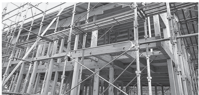
図4：平成29年度建設（山口村営住宅）のカラマツ構造材利用