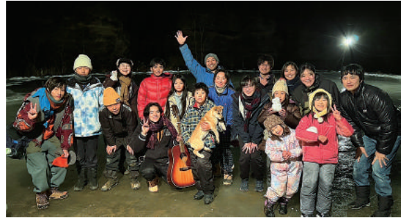
田んぼリンクにて

さんがそば煎餅ややはりはり漬けを、みんなは、すいとうんを作って一緒に食卓を囲んだ。 2日目、三滝山へ行った後、田んぼリンクへ。日中の暖かさの影響でスケートできず…これも天然リンクならではの体験。お雑煮を作って食べながらボランティアの皆さんとお喋り。 3日目、栃原地区のどんど焼き準備では、皆さんパワフルであつという間に完成。帰ってお昼寝したり、村の方が声掛けてくださった場へ赴いたりそれぞれフリータイム。夜は再びど