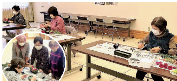
フラワーアレンジメント教室