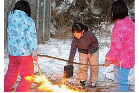
おいしく炊けるかな…

後のマッチで火が点きました。それから燃えやすい枯れ草を走り回って集めてどんどん入れて、苦労の末に一つの班が炊飯に成功しました。なんども消えかけたが、あきらめずにやりきった子ども達。それもあってか、夕食がおいしかったようです。