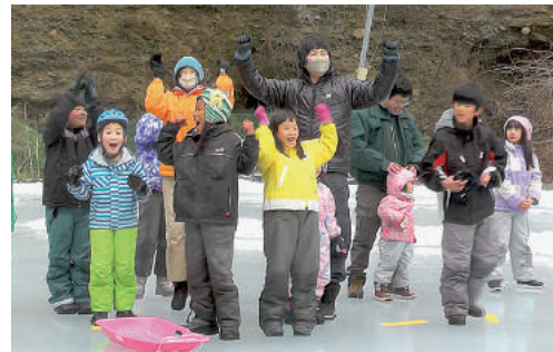
寒いけど楽しかったです！

1月20日(土)に田んぼリンクにて氷上運動会が開催されました。幼児から小学生、引率の大人まであわせて50名の参加申込みがありました。当日は参加者を3チームに分け、3種目の合計得点で競い合いました。行った種目は、