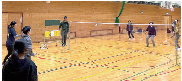
バドミントンはなかなかハード!