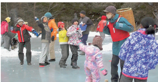
人にはぶつけないでね (笑)

来年度も北相木村ならではの遊び場・楽しい場の一つとして維持管理を続けていきます。ぜひ遊びに来てください。