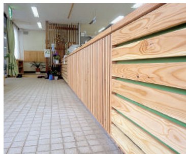
木質化された役場カウンター