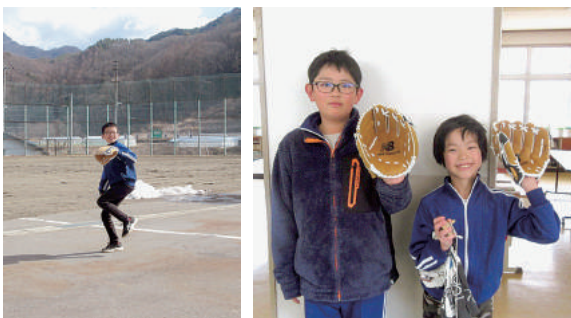
ご結婚おめでとう