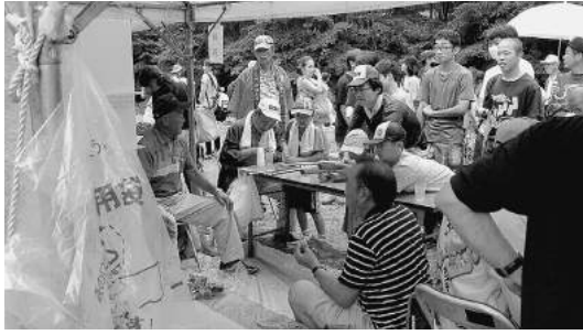
縁日コーナー（射的）

今年も8月14日に長者の森フェスティバルが開催されました。台風の影響で中止も心配されましたが、無事に開催することが出来たのは、長者の森フェスティバルを楽しみにしてくださる方々の熱い思いがあったからではないでしょうか。多少雨の降る時間もありましたが、マスつかみ大会も含めたすべての内容を実施することが出来ました。