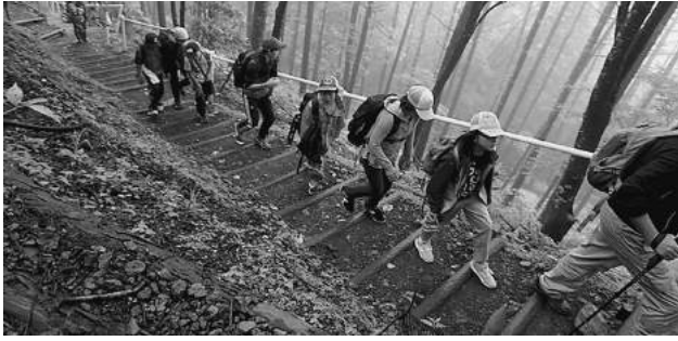
御巢鷹山慰霊碑へ