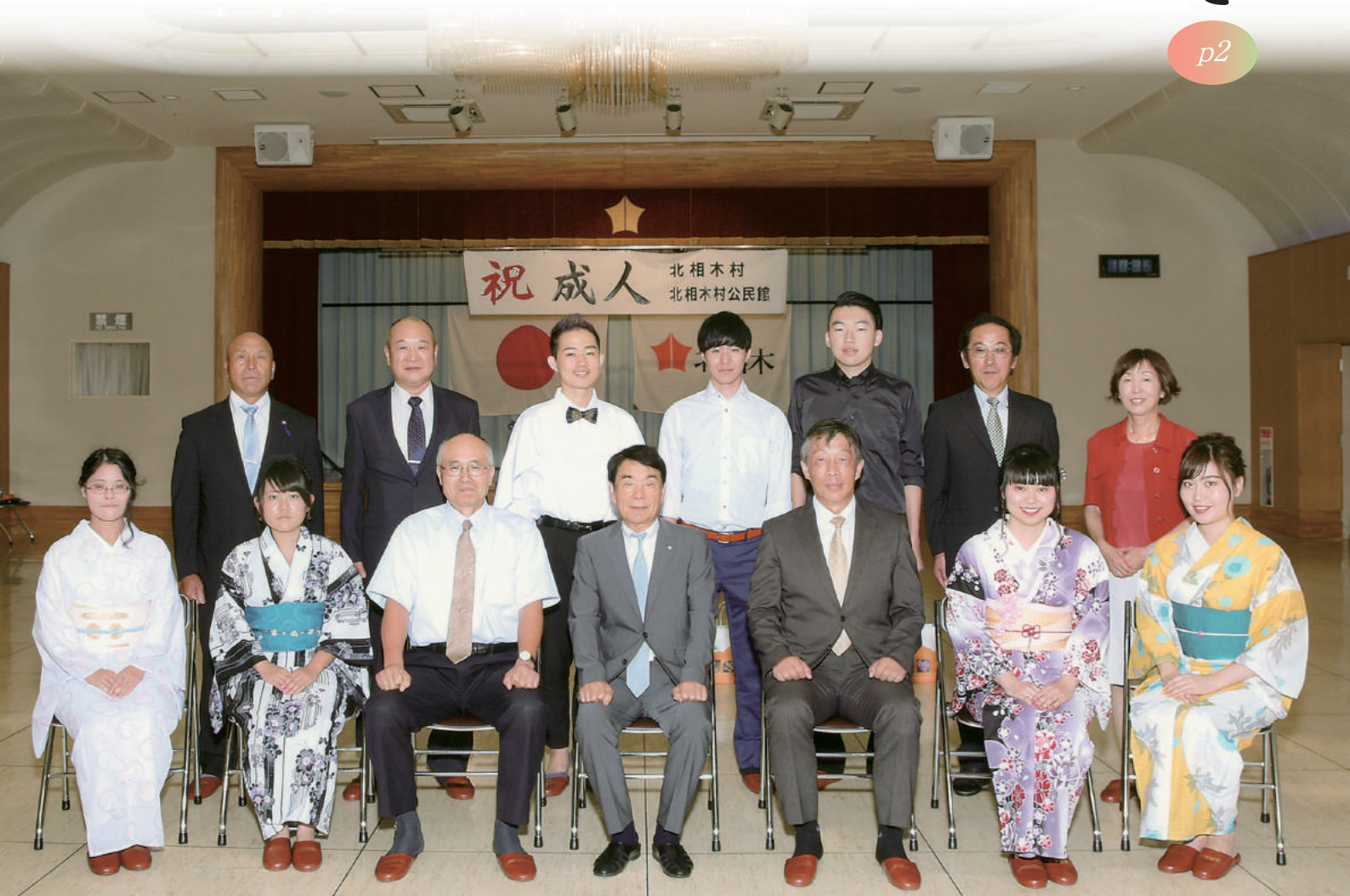
令和元年度成人式