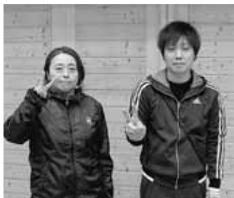
バドミントン優勝 宮ノ平分館