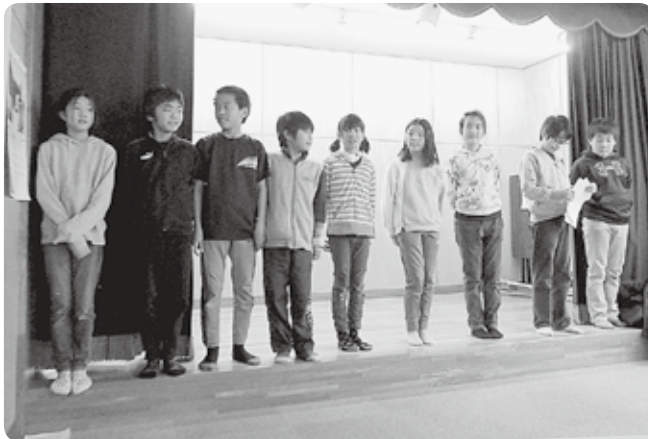
5年生の前日練習(収穫祭のことを発表しました)

「三年生お願いします。」と言われた時、すごく緊張しました。自分が発表する番は、始めの方だったので声が大きくなるか不安でしたが思っていた通りにできてほっとしました。当日は、たくさんのお父さんお母さんがいて、真剣に聞いてくれてがんばったかいがありました。