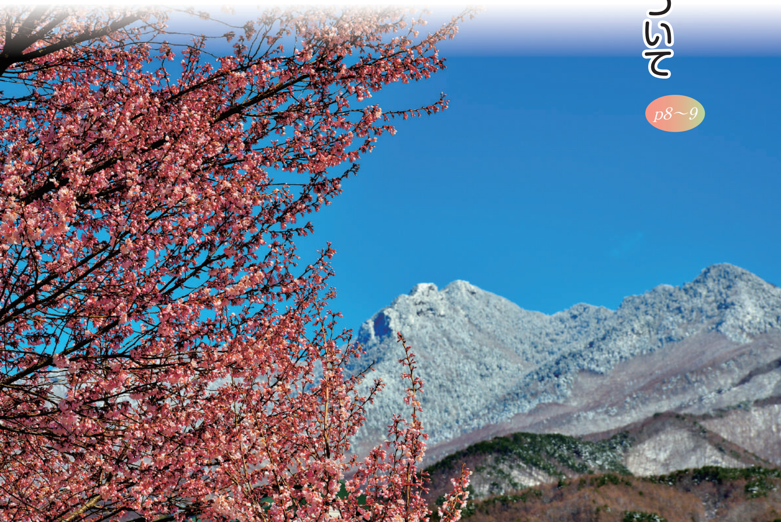
青空にピンクと白のコントラストが絶妙です