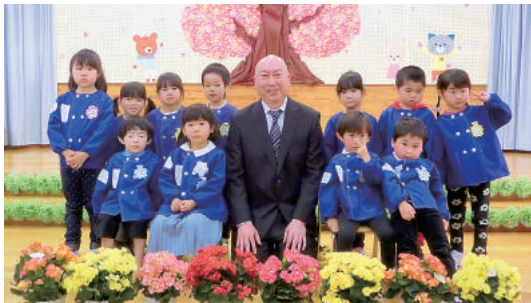
はじめまして、よろしくお願ひします。

今年度は、春の訪れが早く、園庭の桜も満開になりました。新型コロナウイルスの感染拡大による厳しい情勢の中ではありませんでしたが、無事入園式を行うことができました。新入園児4名を迎え全園児16名でスタートしました。今年度は未満児さんも5名に増え、ますます賑やかです。 新年度が始まり、わずかに1週間で登園の自粛をお願ひします。