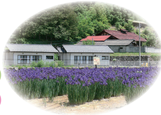
色鮮やかに咲きほこるあやめ