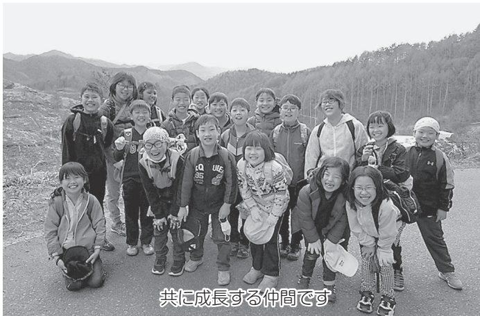
共に成長する仲間です

4月から34期が始まりました。入村してから学校にも行っていないので、センターでの時間はたつぷりありました。子ども達も体調を崩すことなく、みんな元気です。感染対策をしながら、山歩きでは、センターの裏山を歩き、わさびや鹿の角を発見しました。初めに見る鹿の角に感動し、ワイルドなお土産になりました。